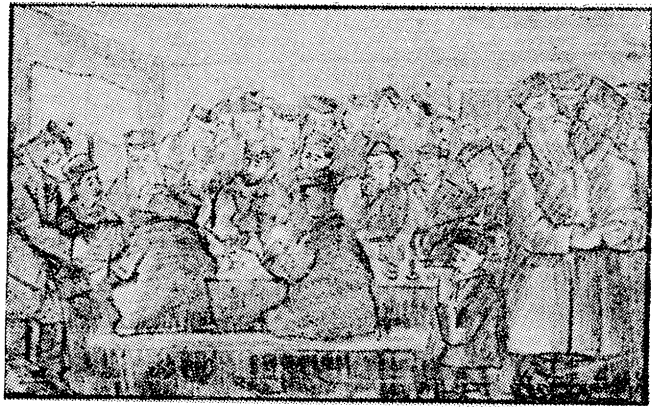
— טרינק, ברודער! — זאָגט ער — טרינק צום חתן! טער טייל, ד' 205